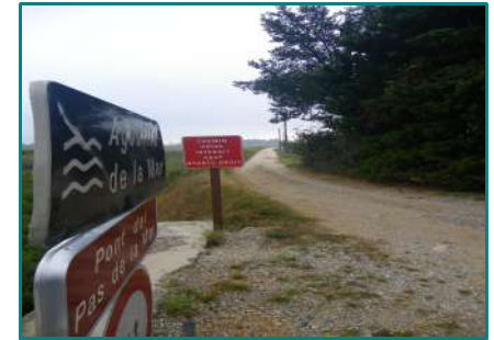
Entrée du chemin